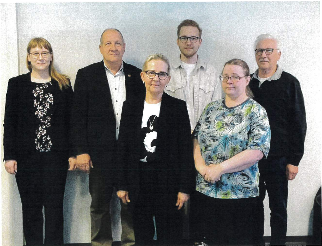
Tarkastuslautakunta ja tilintarkastaja kokouksessaan 1.6.2023

Taloudellisesti vuosi oli edellisen vuoden tapaan hyvä. Merkittävä määrärahaylitys oli sivistystoimissa, 0,3 miljoonaa euroa sekä merkittävä määrärahan alitus sosiaali- ja terveystoimissa, 0,85 miljoonaa euroa. Kunnan ja konsernin tase ovat ylijäämäisiä.